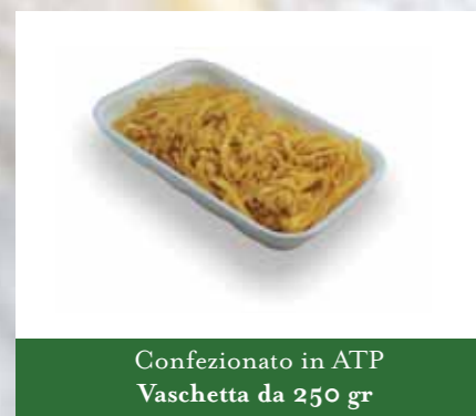
Confezionato in ATP Vaschetta da 250 gr