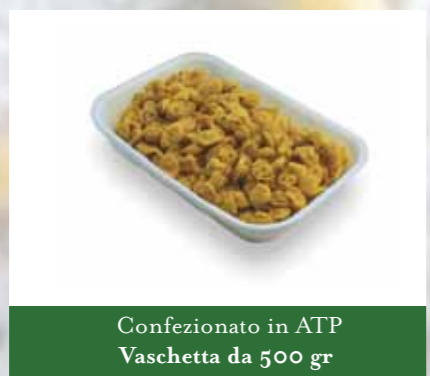
Confezionato in ATP Vaschetta da 500 gr