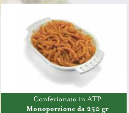
Confezionato in ATP Monoporzione da 250 gr