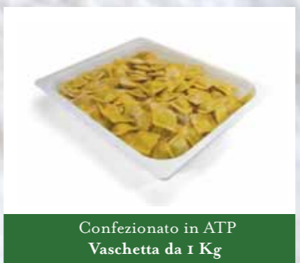
Confezionato in ATP Vaschetta da 1 Kg