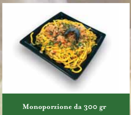
Monoporzione da 300 gr