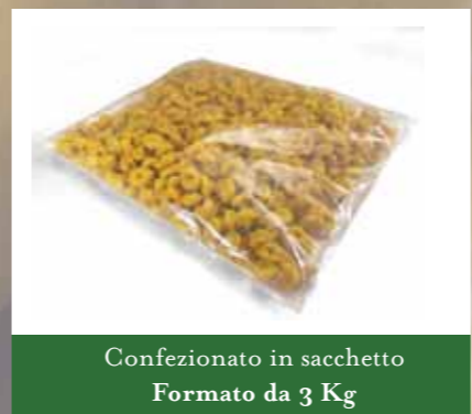
Confezionato in sacchetto Formato da 3 Kg